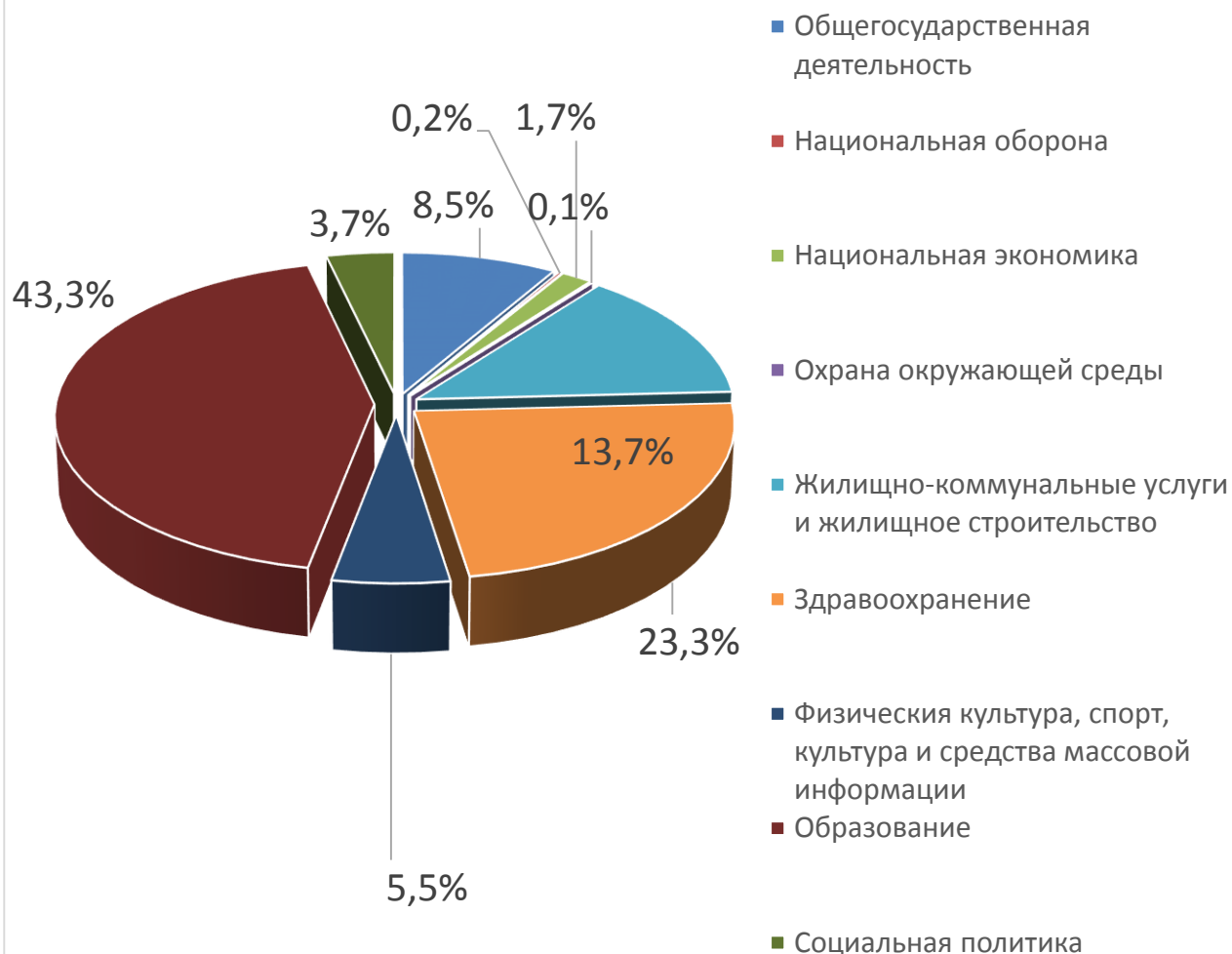
Расходы отраслей консолидированного бюджета Осиповичского района