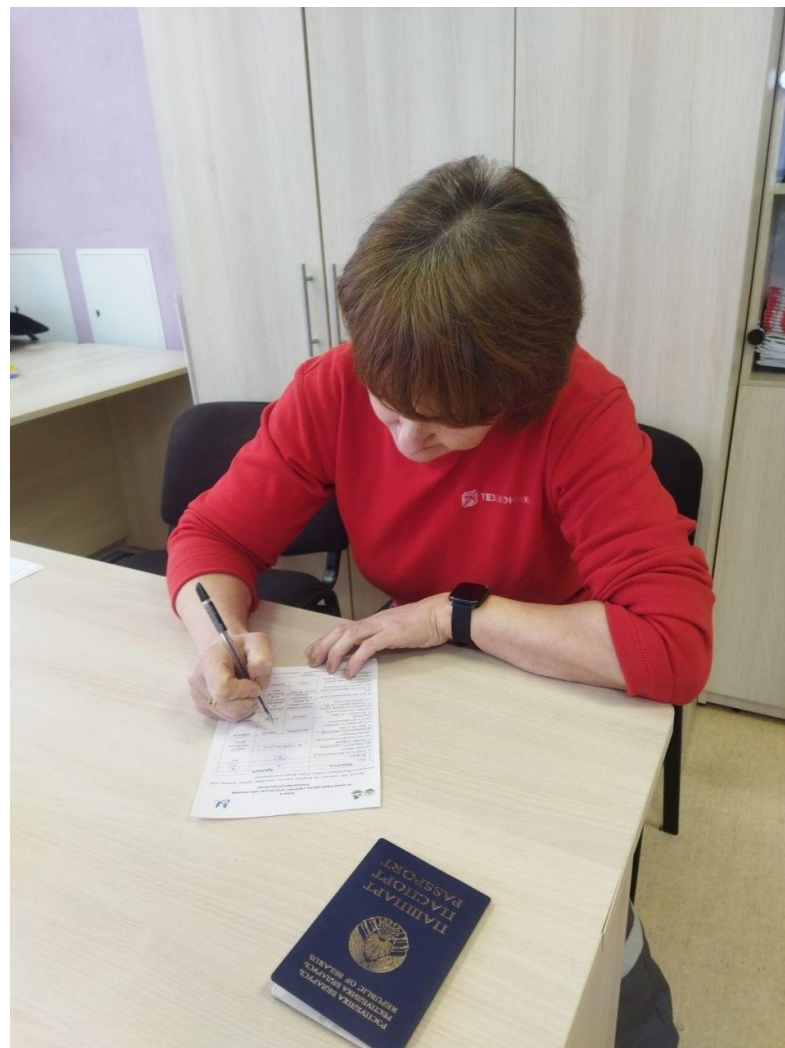
УЗ «Осиповичский райЦГЭ»