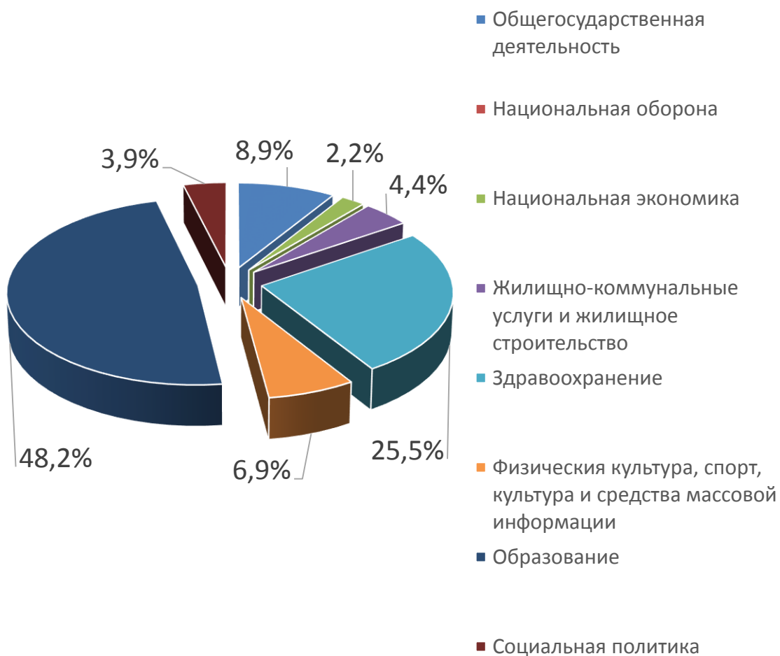
Расходы отраслей консолидированного бюджета Осиповичского района